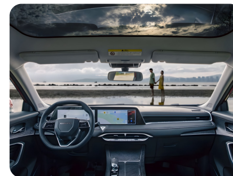
Panel LCD de 24", cámara envolvente 540