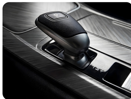
Transmisión DCT de 7 velocidades