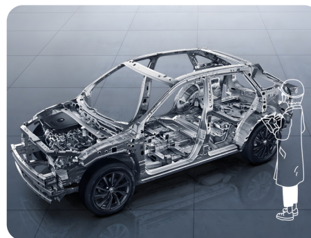
Estructura de Carrocería Zone Body de alta rigidez de Nissan