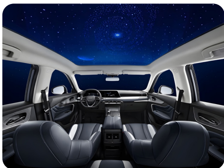
Techo Panorámico de 1.7m